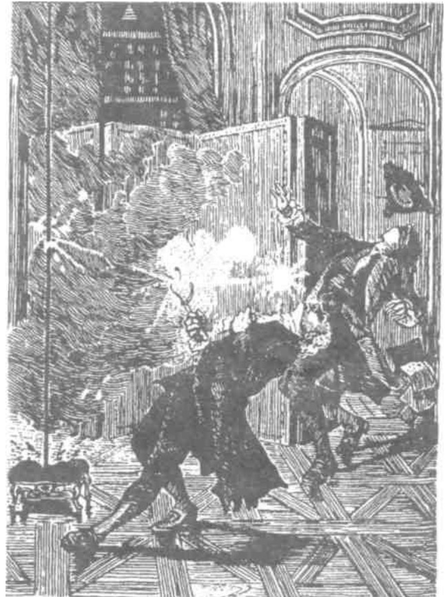
Рис. 2. Трагическая гибель Г.В. Рихмана от шаровой молнии 26 июля 1753 г. Рисунок XIX в.

ны положенные в таком случае "похоронные деньги" и годовое жалованье мужа. Возмущенный несправедливостью Ломоносов пишет письмо вице-канцлеру М.Л. Воронцову (1714 -1767): "... прощением утруждать принимаю смелость ради слез бедной вдовы покойного профессора Рихмана. Оставшись с тремя малыми детьми, не видит еще признаку той надежды о показании милости, которую все прежде ее бывшие профессорские вдовы имели, получая за целый год мужей своих жалованье. Вдова профессора Винсгейма... небедна и детей не имела, однако не токмо тысячу рублев мужнее жалованье по смерти его получила, но сверх того и на похороны сто рублей. А у Рихмановой и за тот день жалованье вычтено, в который он скончался, несмотря на то что он поутру того же дня был в Собрании. Он потерял свою жизнь, отправляя положенную на него должность в службе е. в., то кажется, что его сирот больше наградить должно" [3, т. 10, с. 488 - 489]. "Как хорошо его письмо о семействе несчастного Рихмана!" - восклицает А.С. Пушкин [5] по поводу этого послания Ломоносова, когда рассказывает о великом русском ученом.