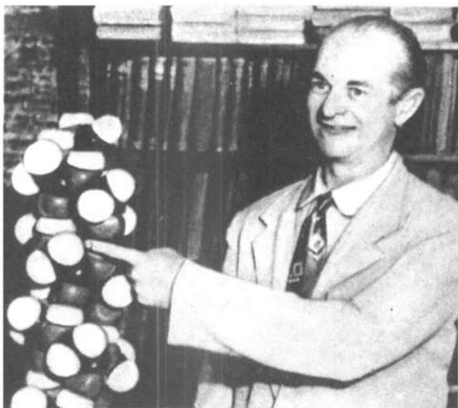
Лайнус Полинг — химик-теоретик.

21 июля 1949 года Армейский корпус связи и Управление морских исследований в Нью-Мексико предоставили Лангмюру и его персоналу возможность провести испытания.